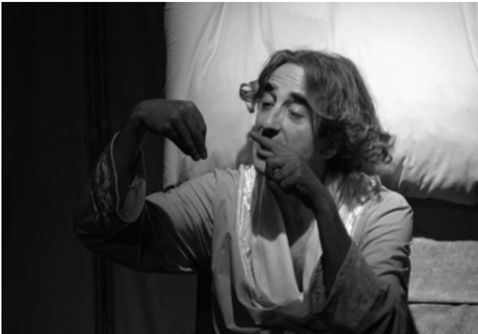
Pigiama Hotel 2003

Uno spettacolo per parlare a tutti. A tutti quelli che sono stati in ospedale, per una ragione o per l'altra, ai malati, a tutti quelli che sono stati malati, a chi ha accompagnato qualcuno in ospedale, a chi ha scoperto un giorno che era malato. E ci è caduto dentro ... come un tuffo improvviso ... che sia freddo caldo piacevole fastidioso ... sai che il vento è cambiato, come uno schiaffo o come una carezza. Uno spettacolo per far sorridere. Uno spettacolo per parlare a tutti. O per strasene insieme, in silenzio.