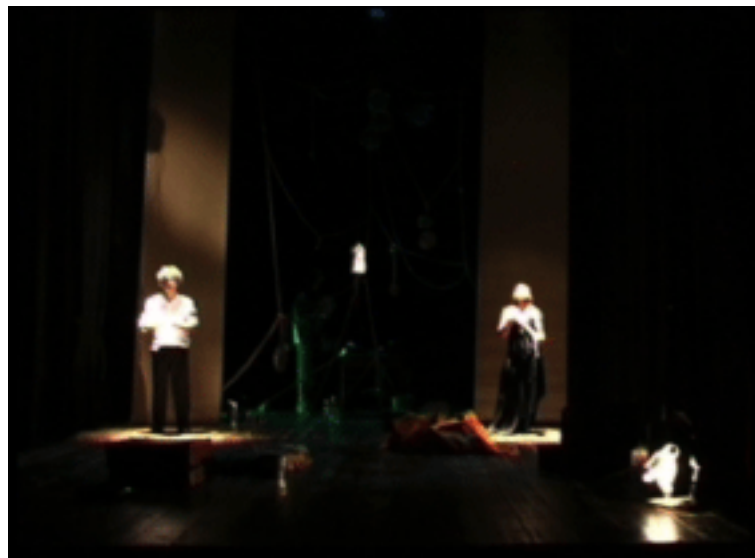
CuoreMelaRossa 2007